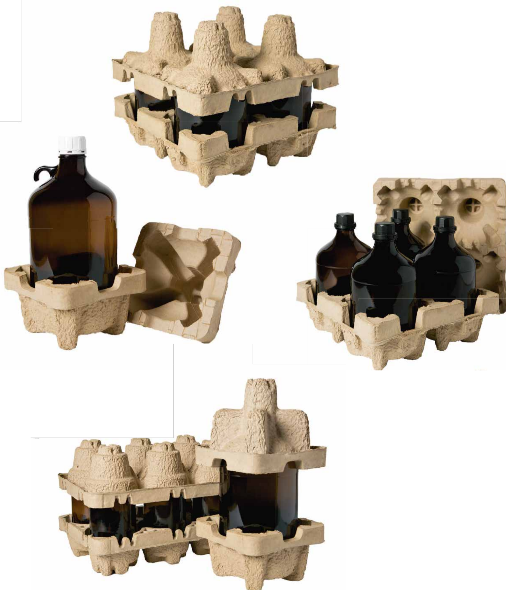
Matériaux : papier ou carton récupérés

Petits moules encastrables qui économisent de l'espace de stockage